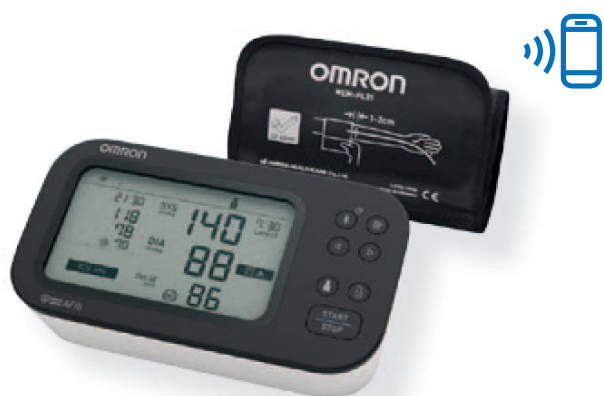
M7 Intelli IT AFib