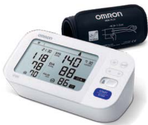
M6 Comfort AFib

Klinicky ověřená přesnost se spolehlivými výsledky, kterým můžete důvěřovat